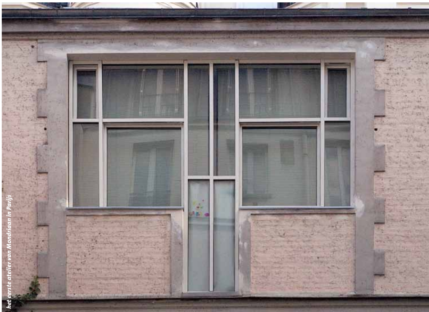
het eerste atelier van Mondriaan in Parijs